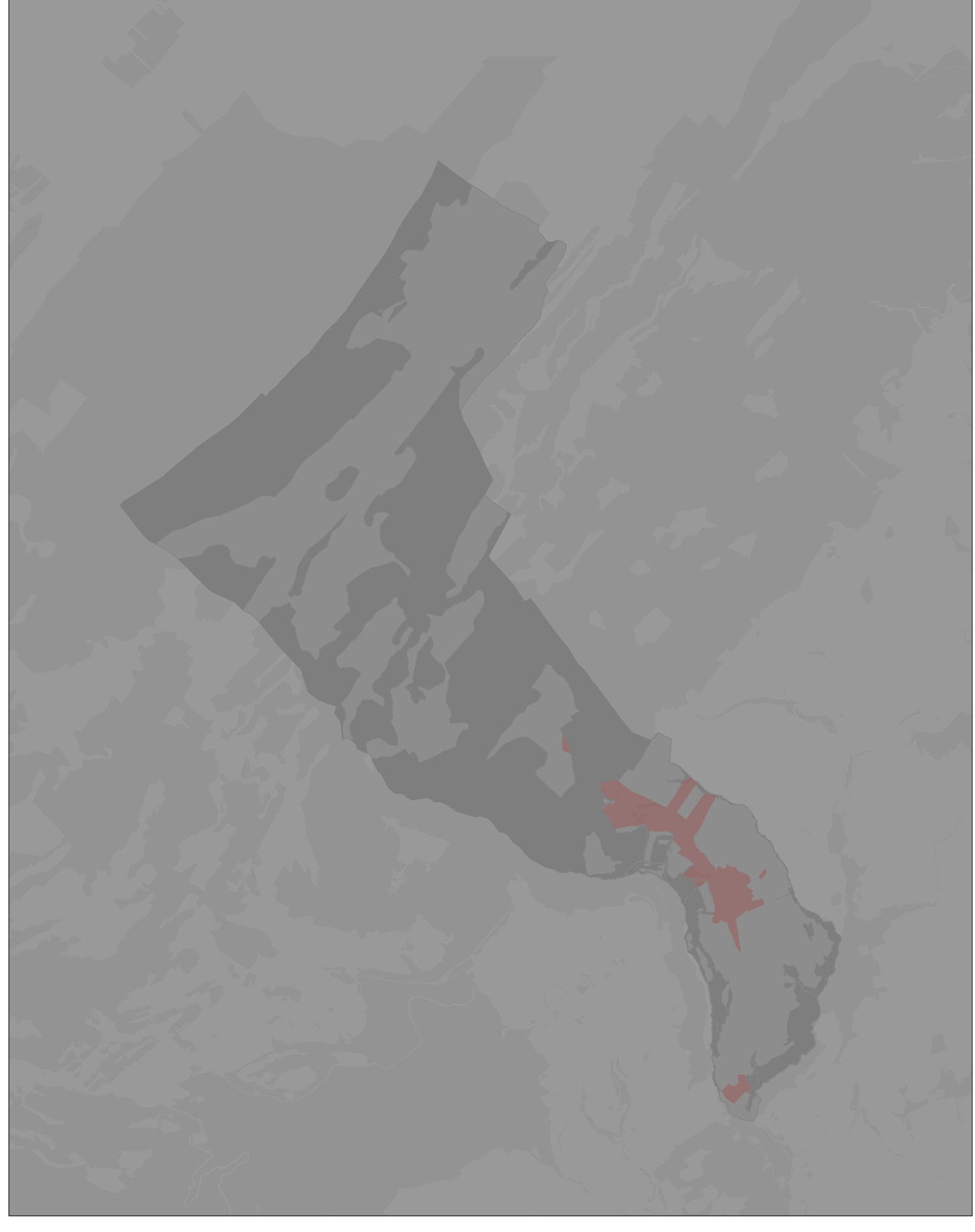
Localisation des secteurs