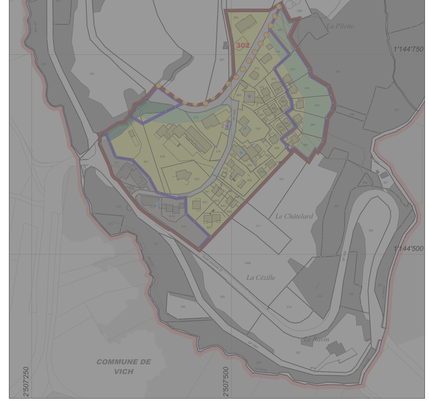
Secteur "La Cézille"